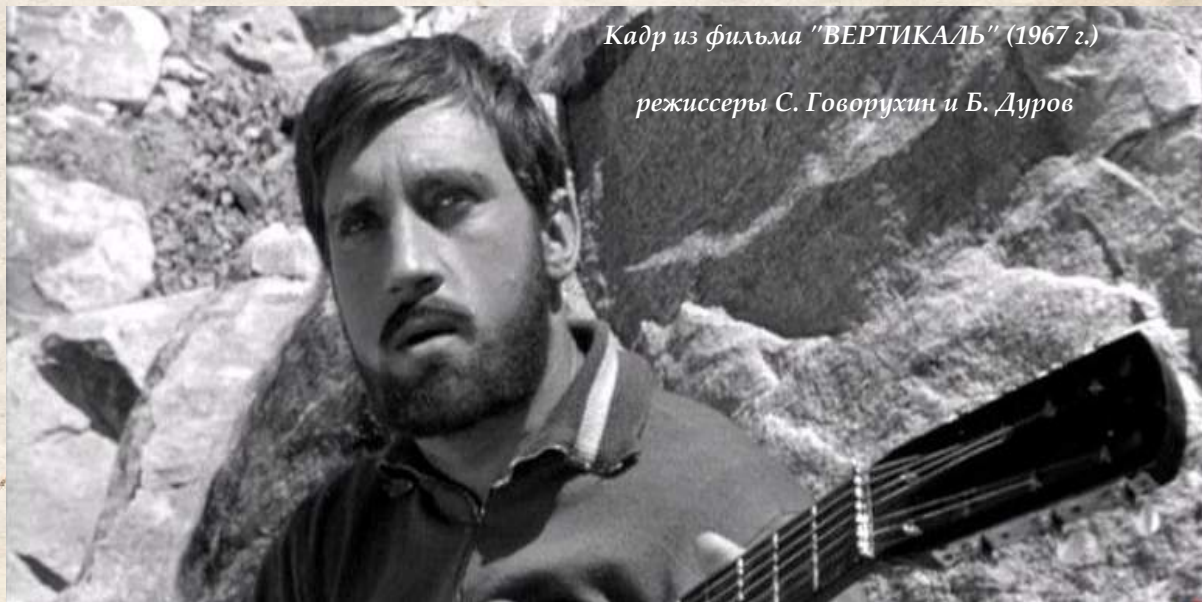
Кадр из фильма "ВЕРТИКАЛЬ" (1967 г.)

К ноябрю ситуация сильно изменилась. Летом вышел фильм "Вертикаль" с участием Высоцкого, популярность которого стала невероятной после показа фильма. Телефоны ГМК-62 разрывались от звонков, все хотели видеть и слышать певца Владимира Высоцкого. Заявок поступало столько, что ни в какую филармонию желающих было не вместить. От одного из куйбышевских заводов пришло 20 тысяч заявок. Было принято решение пригласить Высоцкого во Дворец спорта.