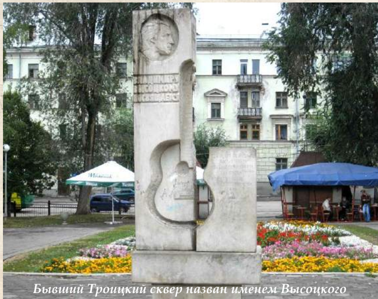
Бывший Троицкий сквер назван именем Высоцкого