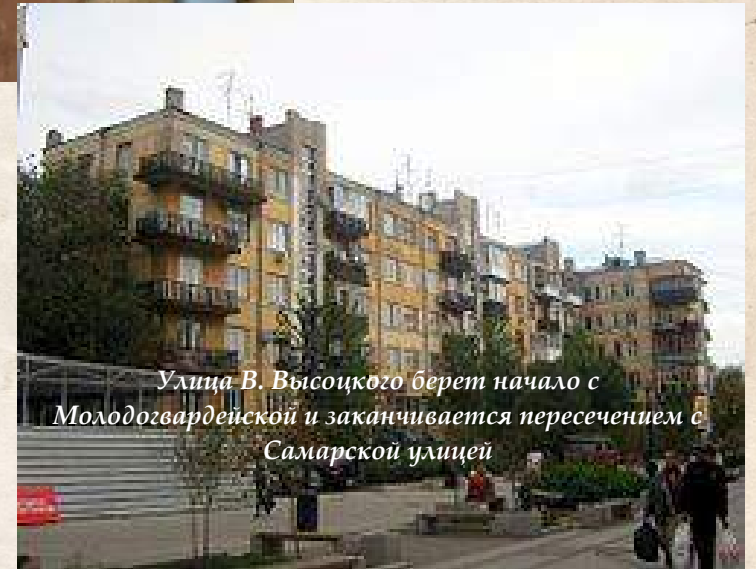
Улица В. Высоцкого берет начало с Молодогвардейской и заканчивается пересечением с Самарской улицей