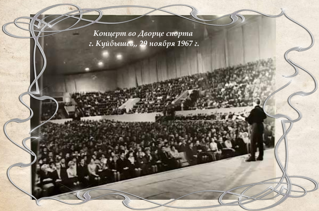
Концерт во Дворце спорта г. Куйбышев, 29 ноября 1967 г.

Больше в Куйбышеве Владимиру Высоцкому выступить не довелось.