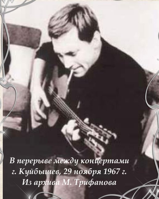
В перерыве между концертами г. Куйбышев, 29 ноября 1967 г.