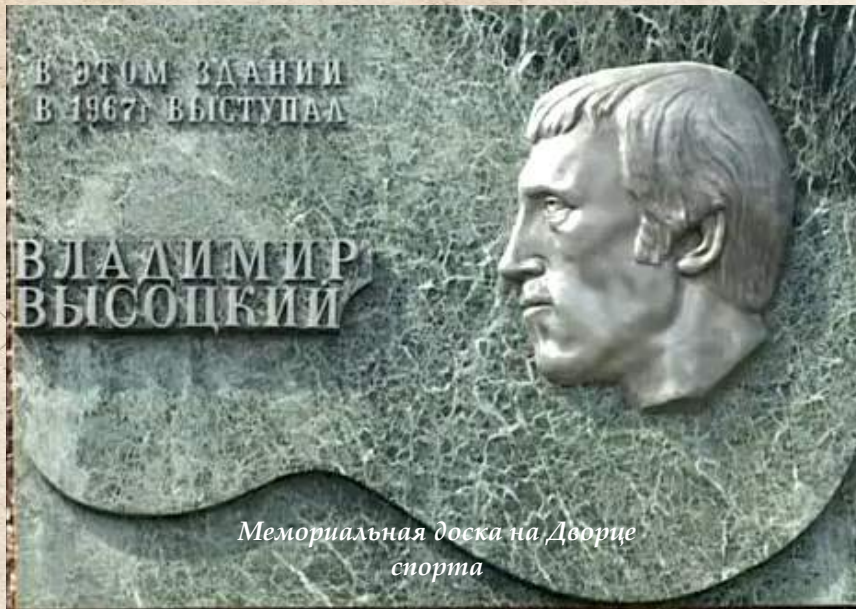
Мемориальная доска на Дворце спорта