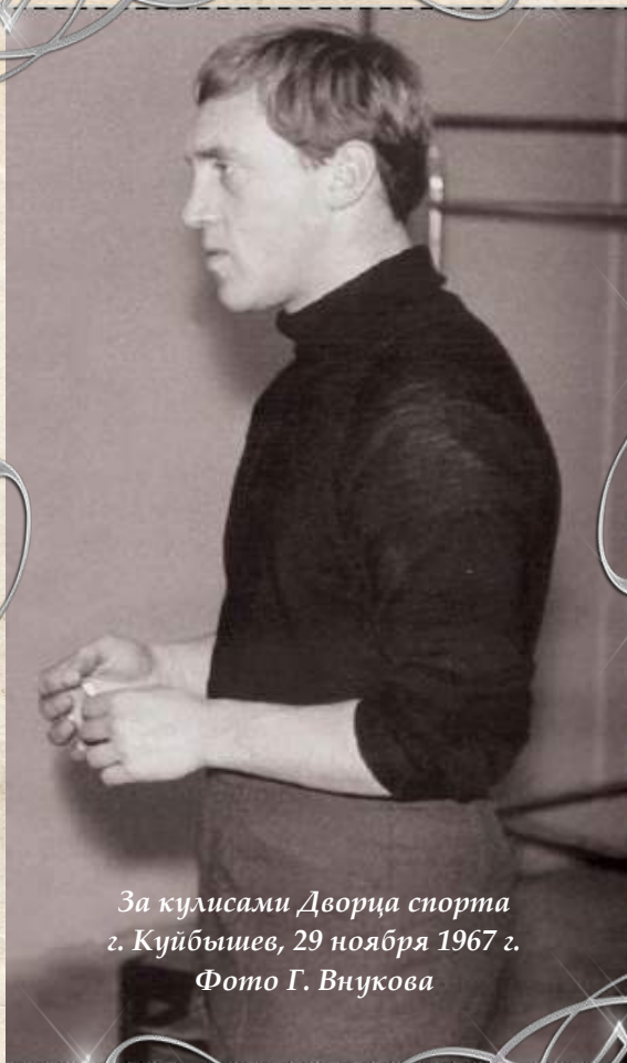
За кулисами Дворца спорта г. Куйбышев, 29 ноября 1967 г.